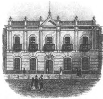
CASA DE MONEDA — 1826