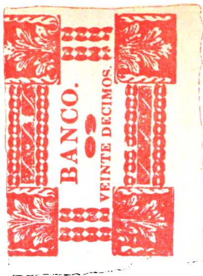
CÉDULAS CONVERTIBLES Á MONEDA DE COBRE, EMITIDAS EN 1825