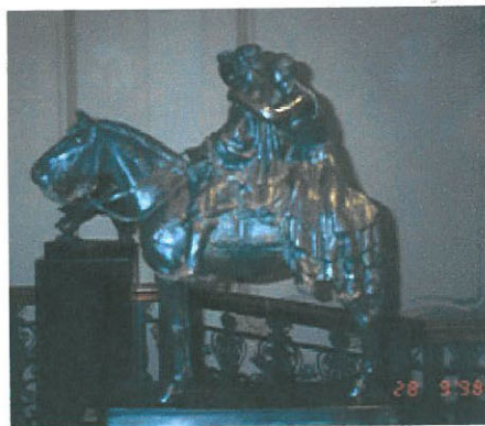
Figura de bronce expuesta En el Museo DEL GAUCHO