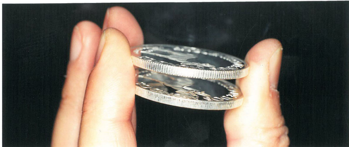
Distintos tipo de estriado en el canto de la moneda de $200 VENADO DE CAMPO.