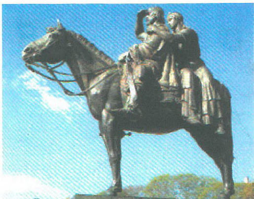
Homenaje a los gauchos, forjadores de nuestra nacionalidad. Inaugurado en Diciembre de 1948 y Emplazado en el Parque Rodó.

Pedimos a la Institución Banco Central, que recibe la autorización de acuñar las monedas y de hacerlas circular, que ,cumplida la primera , publicite y entregue a circulación las monedas que sin duda , nos representaran dignamente en el extranjero, para que los uruguayos pueda verla en circulación, y no que esté limitada a los pocos coleccionistas que al saber su existencia en el Banco concurren a sus oficinas para adquirirla. Que quien reciba en pago una de esas monedas, tenga la certeza que podrá con ella darle el uso que la ley le da al fijarle el valor facial de doscientos cincuenta pesos..-