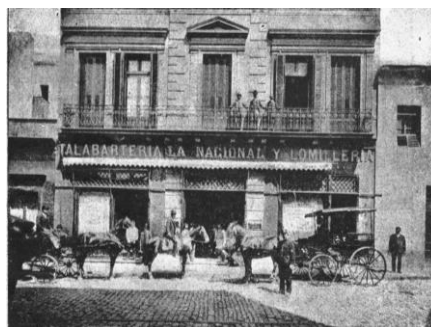
Fachada del lugar de venta de la talabartería