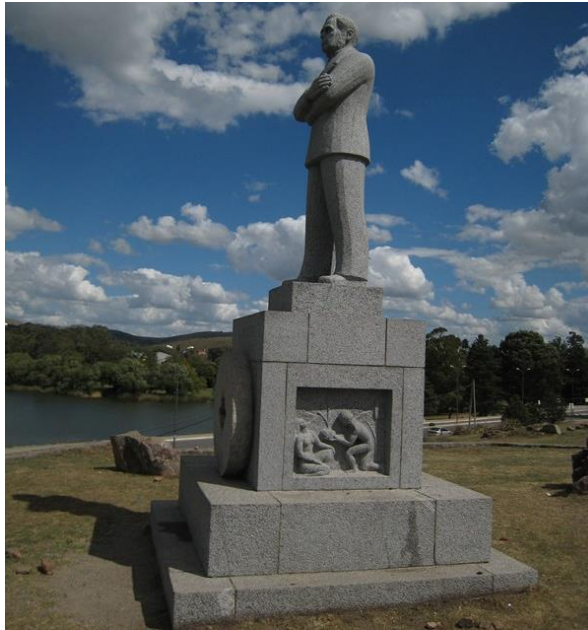
Monumento a Juan Fugl en Tandil

En 1870 se realizó en Tandil el primer concurso de tiro al pájaro, actividad deportiva de notable arraigo entre los integrantes de la colectividad danesa. Desde entonces, esta actividad se ha venido cumpliendo con gran entusiasmo y con algunos períodos de interrupción se ha llegado a 1969, año del centenario de la primera fiesta en esta parte de la provincia de Buenos Aires.