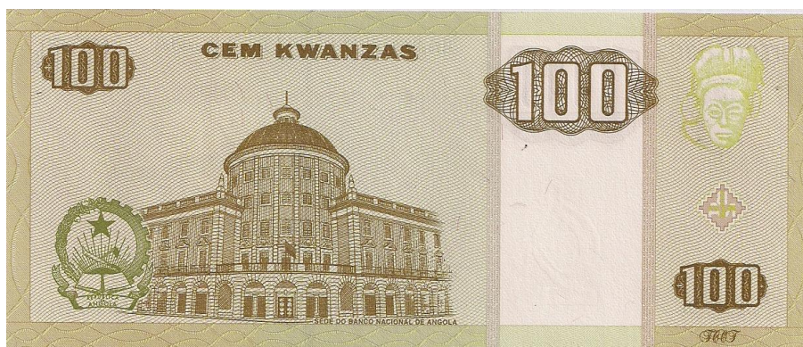
Billetes y monedas colección del autor