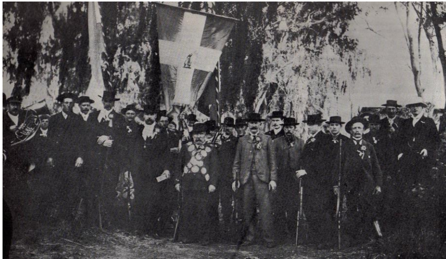
Participantes de uno de los torneos realizados a principio de siglo.

2, luego podrá hacerlo con el 12, el 22, etc., pero siempre abonando una nueva inscripción por vez que se anota. También puede poner un personero si no desea tirar. Pueden participar, además, todas las personas invitadas a la fiesta: damas y caballeros mayores y menores. Cada parte que se derriba tiene su premio que va aumentando a partir de la pieza que tiene el número 1. El detalle de las partes es el que consignamos a continuación.