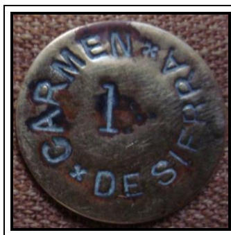
Latas de esquila utilizadas en la actividad punzonadas en bronce.

Ricardo A. Hansen – Diciembre 2014 E mail: ricardohansen2003@yahoo.com.ar